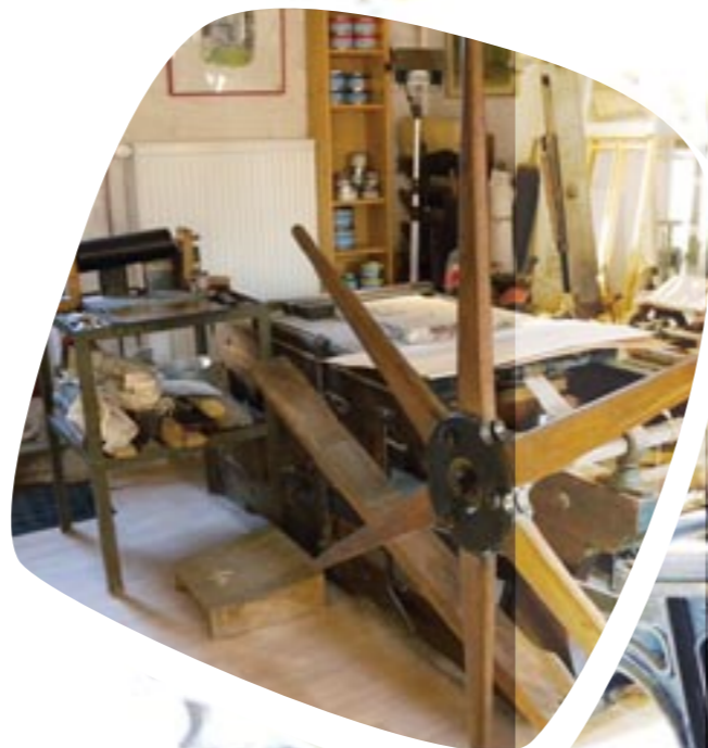
presse à bras